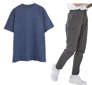
▲セール中は(左)ヘビーウェイト T シャツが 989 円、(右) ナイロンストレッチパンツが 550 円安く 2,739 円 ※いずれも税込